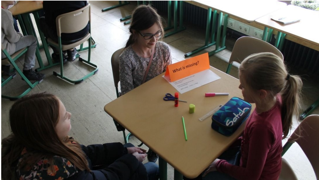
Im Englischunterricht wurden die ersten Worte bei Spielen geübt.

Ankum. Beim Tag des offenen Unterrichts haben sich Eltern sowie Schüler, die nach dem Sommer zur weiterführenden Schule gehen, ein Bild von der August-Benninghaus-Schule gemacht. Rund 300 Besucher hatten sich für den Schnuppertag an der Oberschule angemeldet.